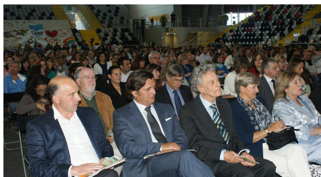
Representantes das entidades que presidiram à sessão de abertura do Encontro Nacional de Avaliação das Atividades das CPCJ

comissões, o anfitrião do evento afirmou ser “inadmissível que uma criança que seja abusada [sexualmente] com 14 anos dependa dos pais para ser exercida queixa criminal”. Sabendo que “a maior parte desses maus tratos acontece em casa”, considera que “deveria ser o Ministério Público e não os pais a dizer quem é responsável pela ação penal”.