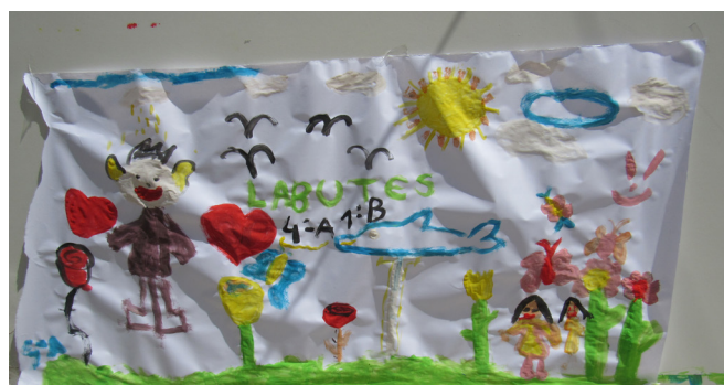
Pinturas na A.S.M. Setubalense

A Associação de Socorros Mútuos Setubalense organizou um encontro intergeracional, no qual participaram 150 crianças da Escola Básica nº 2, de Setúbal, e 40 idosos do Centro de Dia da instituição. Neste dia de convívio, realizaram-se ateliês de pintura, missangas, doces e jogos tradicionais.