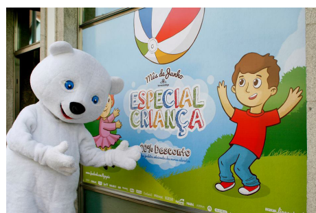
Campanha Especial Criança da Farmácia da Liga de Gaia

Durante o mês de junho, a Liga das Associações de Socorro Mútuo de Vila Nova de Gaia promove a Campanha Especial Criança, na Farmácia da Liga, com 20% de desconto em marcas e produtos selecionados, dedicados ao bem-estar e cuidado infantis. ■