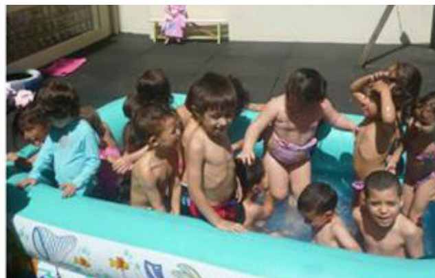
Dia de convívio e diversão no Infantário da Benéfica e Previdente

A Associação Benéfica e Previdente - Associação Mutualista assinalou o dia, no Infantário Flor de Abril, com pinturas, plasticinas comestíveis e banhos de piscina, que fizeram as alegrias dos meninos e meninas.