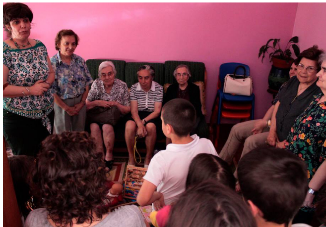
Idosos da Mutualista Covilhanense durante a entrega de brinquedos

a uma instituição de cariz social para oferecerem roupas e brinquedos recolhidos entre os dias 26 de maio e 1 de junho. Neste dia de convívio intergeracional, houve oportunidade para se cantarem algumas canções, que culminaram com uma calorosa troca de sorrisos e abraços entre idosos e crianças.