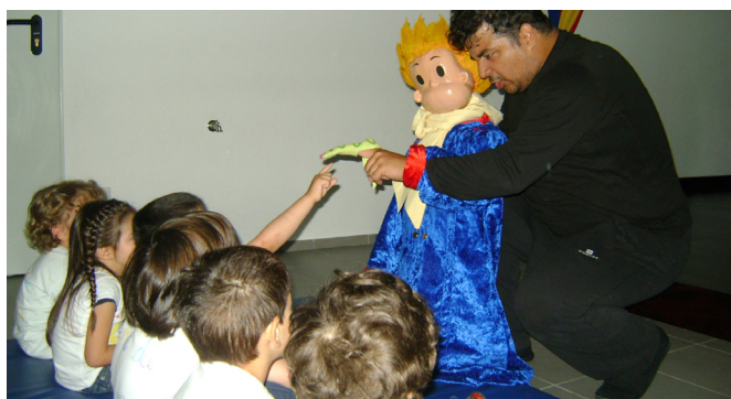
Crianças assistem à peça de teatro "O Príncipezinho"

A Associação de Socorros Mútuos de S. Francisco de Assis de Anta, em Espinho, proporcionou um momento cultural às crianças que frequentam a Creche "O Portugal dos Pequeninos", com a apresentação da peça de teatro "O Príncipezinho", interpretada pela Companhia de Teatro Etcetera Associação Artística.