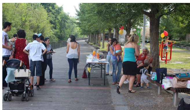
Dia de convívio dinamizado pela ASMAB

Por sua vez, a Associação de Socorros Mútuos dos Artistas de Bragança (ASMAB) organizou um dia de convívio entre as crianças da Creche Familiar e as suas famílias, com a realização de um piquenique, ao ar livre, no Parque Polis de Bragança.