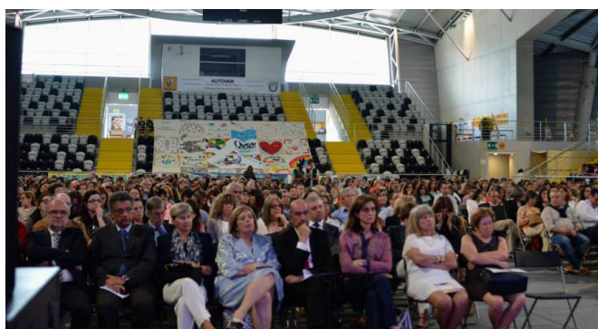
Audiência do Encontro Nacional de Avaliação da Atividade das CPCJ