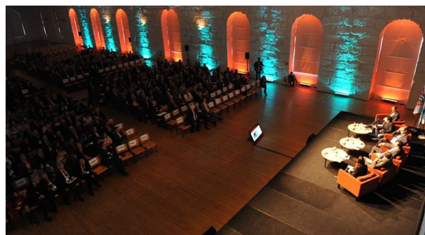
Panorâmica do I Encontro Nacional de Instituições de Solidariedade