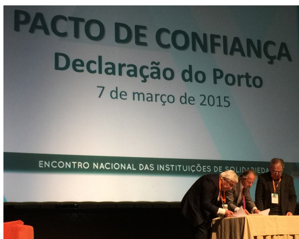
Entidades representativas da Economia Social Solidária formalizando o Pacto de Confiança

O pacto assinado a 7 de março, no Porto, assume-se como um reflexo das vontades comuns expressas no I Encontro Nacional das Instituições de Solidariedade, subordinado ao lema «Um por todos, todos por um – Na Defesa do Estado Social», pela União das Mutualidades Portuguesas, pela Confederação Nacional das Instituições Sociais e pela União das Misericórdias Portuguesas.