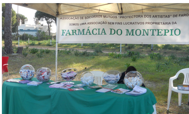
Expositor da A.S.M. Protetora dos Artistas de Faro

A Associação de Socorros Mútuos "Protetora dos Artistas" de Faro participou na organização da 16ª Marcha Corrida e 1º Mini Trail da Ria Formosa, que decorreu no passado dia 15 de março, em Faro, em parceria com a Câmara Municipal de Faro e outras vinte entidades concelhias associativas e empresariais.