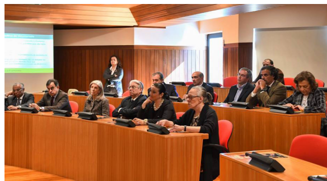
Conselho Consultivo do Voluntariado

dações para a ação da Confederação”. O Conselho Consultivo do Voluntariado tem, ainda, como objetivos promover o “papel do voluntariado na sociedade portuguesa, evidenciar o contributo do voluntariado para o desenvolvimento da cidadania”, dando “visibilidade à reflexão nacional”. ■