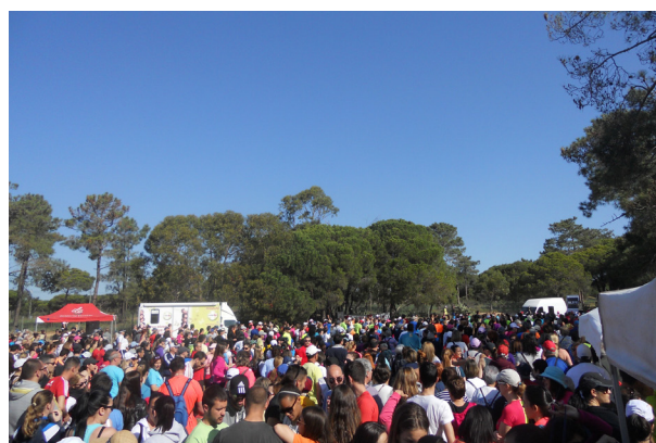
Participantes da 16ª Marcha Corrida da Ria Formosa

A este evento desportivo aderiram cerca de 4000 pessoas, superando o número de participantes das edições anteriores, tendo sido realizado, pela primeira vez, o Mini Trail da Ria Formosa, atividade de cariz mais competitivo, que contou com 117 participantes. A 16ª Marcha Corrida e 1º Mini Trail da Ria Formosa revelou-se um sucesso, na medida em que permitiu a confraternização entre todos os participantes, potenciando a consciencialização para a prática da atividade física e do desporto em contacto com a natureza. ■