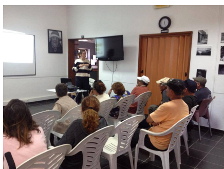
Ação de Sensibilização Monte-pio Artístico Tavirense

No passado dia 19 de março, o Monte-pio Artístico Tavirense - A.S.M. esteve no quartel dos Bombeiros Voluntários de Tavira para realizar rastreios à população e aos bombeiros. Esta associação deslocou-se, também, até Santa Luzia, no Algarve, no dia 28 de março, onde realizou rastreios cardiovasculares aos utentes da Associação de Almadrava.