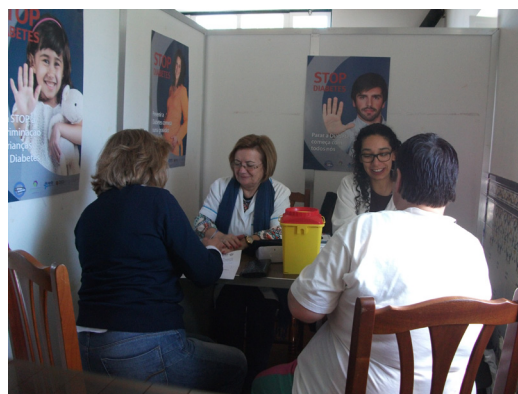
Rastreios médicos realizados pelo Legado do Caixeiro Alentejano, em Évora

Por sua vez, o Legado do Caixeiro Alentejano - Associação Mutualista, em parceria com a Associação de Socorros Mútuos Setubalense, realizou, nos dias 26 e 27 de março, ações de sensibilização e cerca de 80 rastreios médicos, na cidade de Évora.