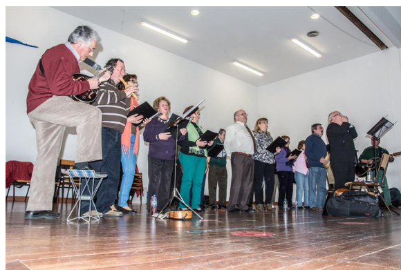
Momento musical "Tantos e + Um"

Este dia contou também com alguns momentos musicais, proporcionados quer pelos professores da escola, quer pelo grupo musical "Tantos & + Um", da "Mutualista Covilhanense". ■