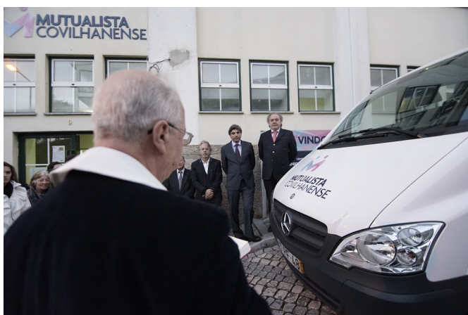
Cerimónia da bênção da viatura adaptada

A A.S.M. “Mutualista Covilhanense” adquiriu um veículo adaptado para transporte de pessoas com mobilidade condicionada, dando resposta a um desejo antigo.