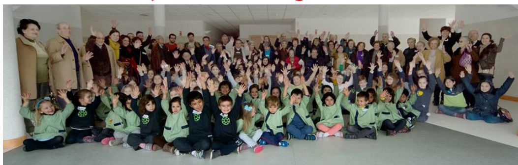
Participantes das Jornadas Culturais da Escola Internacional da Covilhã

No dia 20 de março, os utentes da Associação de Socorros Mútuos "Mutualista Covilhanense" participaram nas Jornadas Culturais da Escola Internacional da Covilhã (EIC).