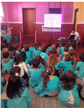
Ação de sensibilização a crianças, no Centro Infantil de Santa Maria de Lamas