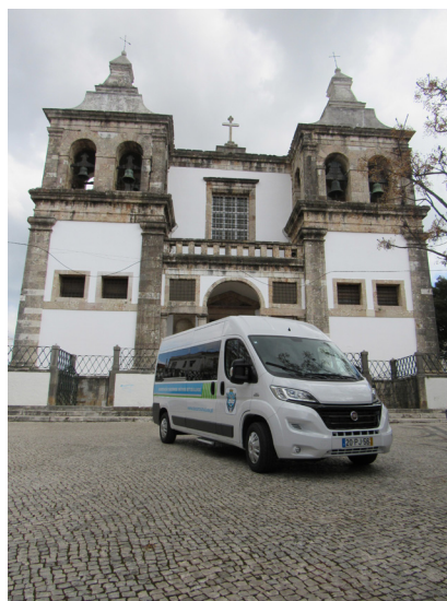
Nova viatura adaptada da A.S.M. Setubalense