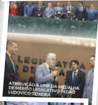
ATRIBUIÇÃO À UIMP DA MEDALHA DE MERITO LEGISLATIVO PEDRO LUDOVICO TEIXEIRA