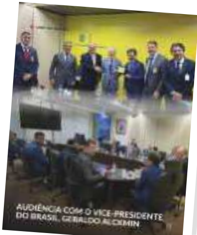
AUDIÊNCIA COM O VICE-PRESIDENTE DO BRASIL, GERALDO ALCEMIN