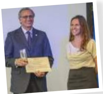
Momento Entrega à Associação Entrajuda

A UMP atribuiu o Prémio Cidadania e Solidariedade à Associação Entrajuda, reconhecendo o seu papel estruturante na valorização do voluntariado, da responsabilidade social e da dignidade humana, com impacto direto nas comunidades mais vulneráveis. Esta organização junta voluntários para apoiar as instituições de solidariedade social no combate à pobreza, ajuda-as a mudar procedimentos e transformar realidades, através de ações de formação e ferramentas de gestão, e doa bens e equipamentos recuperados e reciclados para reutilização.