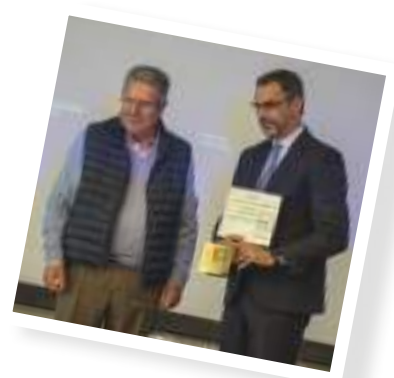
Momento Entrega à Fundação Calouste Gulbenkian

O Conselho de Administração da UMP atribuiu o Prémio Mutualismo e Solidariedade, categoria Internacional, à Fundação Calouste Gulbenkian, em reconhecimento pelo seu contributo relevante para a promoção da solidariedade além-fronteiras e pelo apoio à transformação social sustentável.