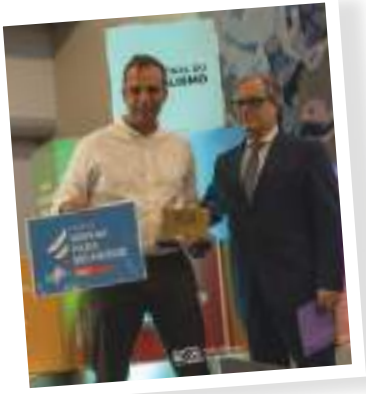
Momento Entrega à Beneficência Familiar

A UMP procedeu à entrega do Prémio Inovar para Melhorar à A Beneficência Familiar – Associação de Socorros Mútuos do Porto, distinguindo o projeto ABF Exercício – Saúde, Movimento e Comunidade, uma iniciativa inovadora desenvolvida na Baixa do Porto, que promove uma abordagem integrada à saúde, centrada na pessoa. Este projeto conjuga exercício físico, reabilitação, bem-estar emocional e lazer terapêutico, afirmando-se como um exemplo concreto de como a inovação pode reforçar a resposta mutualista às necessidades atuais das comunidades, valorizando a proximidade, a prevenção e a qualidade de vida.