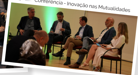
Conferência - Inovação nas Mutualidades