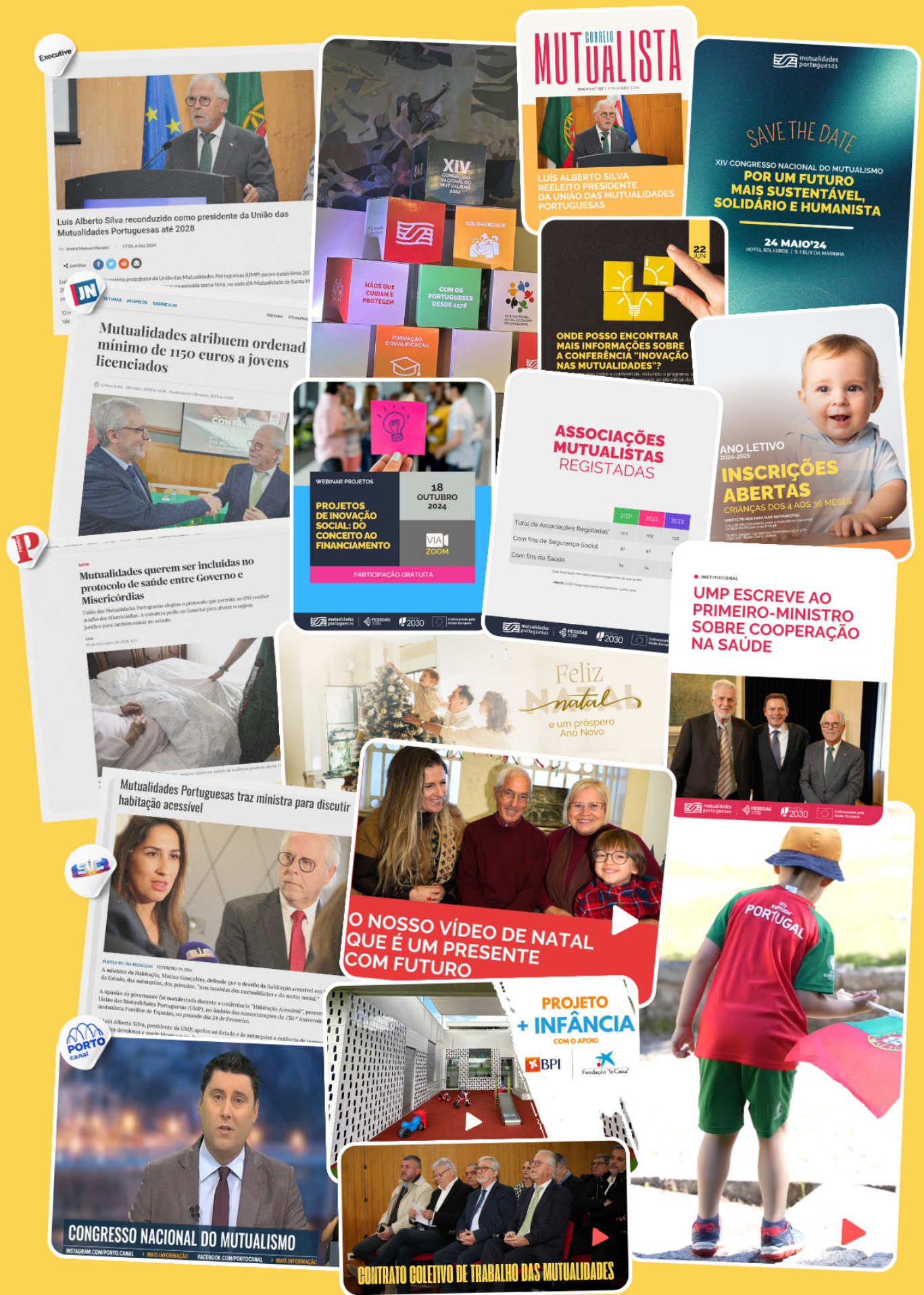
Acima, imagens de alguns dos momentos mais mediáticos da UMP em 2024, e das principais comunicações realizadas.