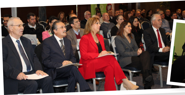
Conferência - Habitação Acessível