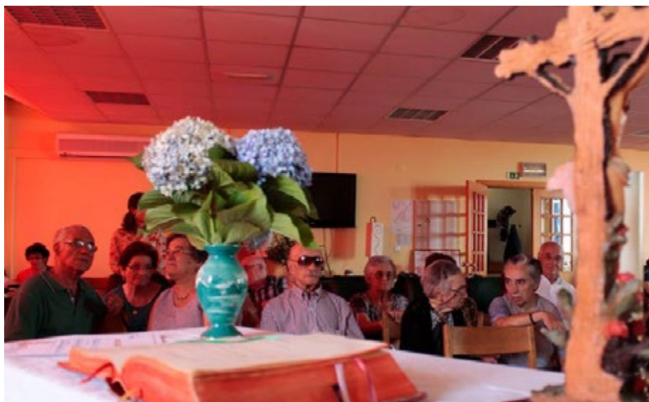
A Eucaristia foi vivida com intensidade pelos utentes da Mutualista Covilhanense

“Jovens Sem Fronteiras” é um movimento de jovens católicos ligados à Congregação dos