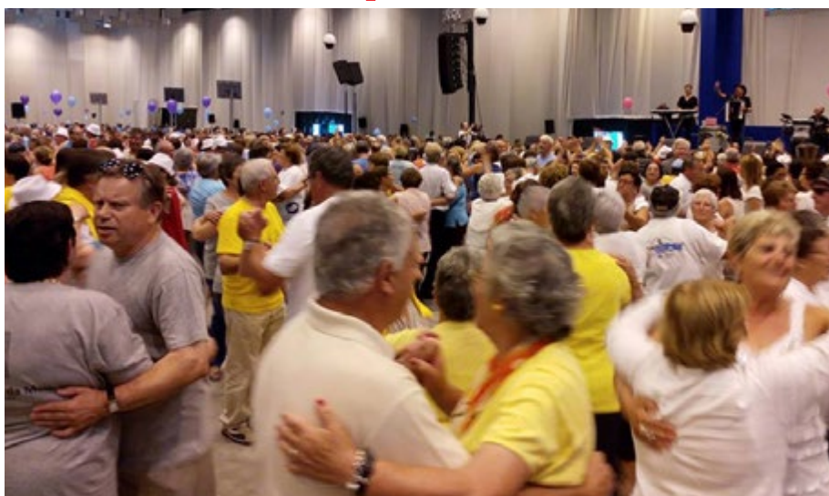
Os avós mostraram que a idade não é impeditiva na hora de se divertirem

A tarde contou com a animada presença do cantor popular Quim Barreiros, com a atuação do Rancho Folclórico Infantil de São Paio de Oleiros e com um espetáculo de Danças Medievais do Grupo Corte de Vila da Feira. Esta iniciativa teve como principal objetivo valorizar o papel social dos avós, enquanto mais-valia na comunidade, ao