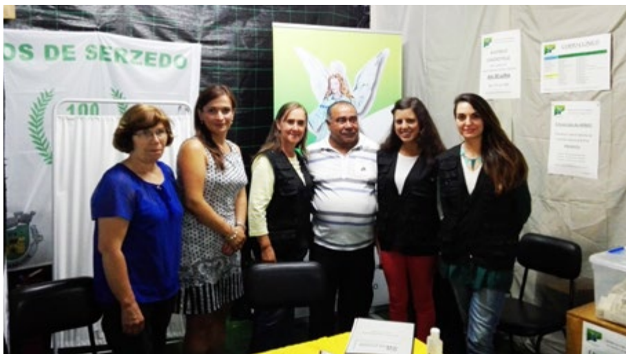
O rastreio ao cancro da pele teve uma forte adesão

A Associação de Socorros Mútuos de Serzedo participou, entre os dias 24 de julho e 1 de agosto, na Semana Cultural de Serzedo, procurando divulgar o trabalho da instituição, a fim